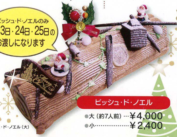
ビッシュド・ノエル(大)